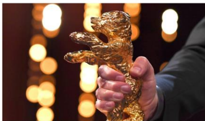
O urso de ouro é o prêmio oferecido ao filme vencedor na categoria de melhor filme do Festival de Cinema de Berlim

dom, 14/04/2024 - 10h15 | Do Portal do Governo